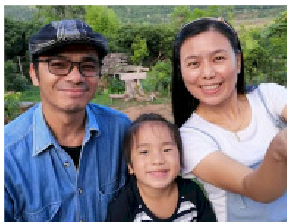
Phu (tv) og Dtom sammen med deres søn

At komme på husbesøg hos de børn og familier AIDS Care støtter i Chiang Dao var derfor en udfordring.