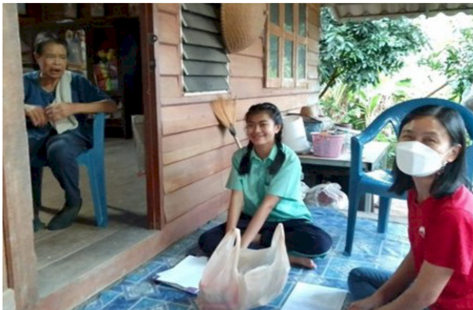
Nong Ton Khao sammen med AIDS Care's lokale medarbejder

Nu kan tante ikke gå normalt, hvilket betyder, at hun ikke kan have et normalt arbejde. Den daglige indtægt kommer nu