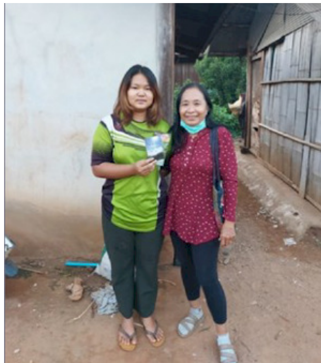
Kung Ging (t.v.) sammen med AIDS Care's lokale projektleder.

Hun er kun 17 år og går stadig i skole. Hun er nødt til at arbejde samtidig, selvom det at finde arbejde har været vanskeligt på grund af COVID-19 situationen.